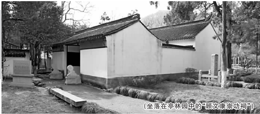
(坐落在亭林园中的“文康崇功祠”)

三是鼓励组织和个人创作中医药文化和科普作品。中医药文化和科普作品是进行中医药文化宣传和知识普及的重要载体和路径。同时,中医药文化和科普作品有其自身不可忽略的产业价值。县级以上人民政府要遵循《中医药发展战略规划纲要(2016—2030年)》的规定,推动中医药与文化产业融合发展,探索将中医药文化纳入文化产业发展规划。创作一批承载中医药文化的创意产品和文化精品。促进中医药与广播影视、新闻出版、数字出版、动漫游戏、旅游餐饮、体育演艺等有效融合,发展新型文化产品和服务。培育一批知名品牌和企业,提升中医药与文化产业融合发展水平。